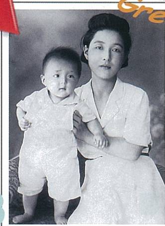
褪せた写真をモノクロに ※キズ、破れ、シミ、カビなどの修復・修正、モノクロ変換