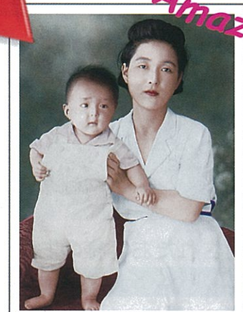
モノクロ写真を色再現 ※色彩加工、カラー変換、テクスチャーによる画像効果