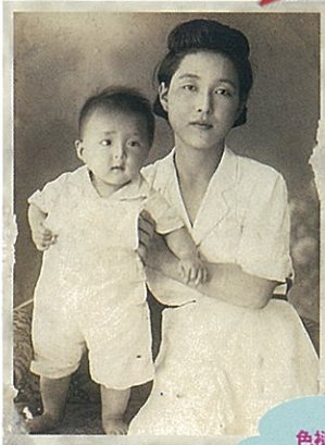
色褪せた写真が こんなに綺麗になるなんて...

すっかり色褪せてセピア調になってしまった大切な思い出の写真!! もし、この写真が鮮やかな色を取り戻せたら・・・